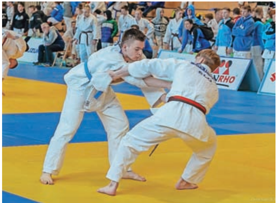
V novi Športni dvorani Žiri je v začetku marca potekal peti Judo pokal Žirov.

Dan po petem Judo pokalu Žirov je na isti lokaciji potekalo še državno prvenstvo v judu za kadete in kadetinke do 18 let, ki bi moralo biti v začetku letošnjega leta v Lendavi, vendar je bilo zaradi