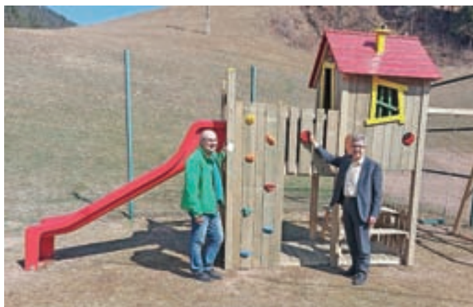
Novo otroško igralo pri gasilskem domu PGD Račeva