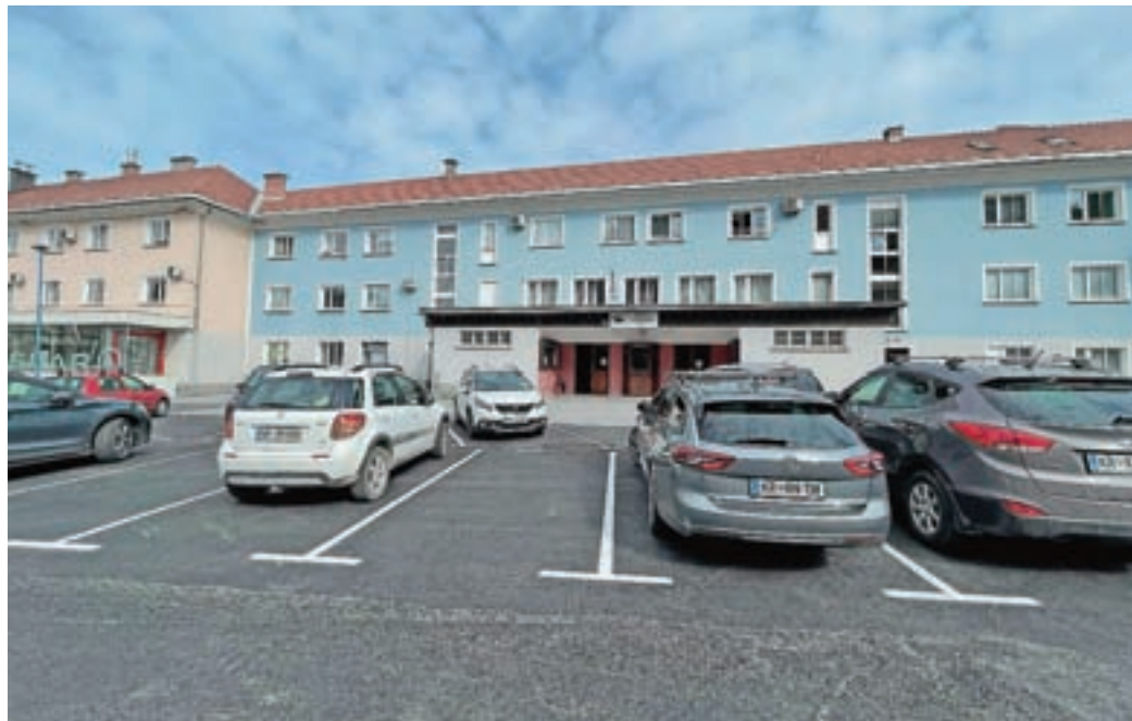
Urejeno parkirišče pred vhodom v dvorano DPD Svoboda

Na severozahodnem delu Zdravstvene postaje je bilo urejenih dodatnih sedem parkirišč, ki pa so namenjeni izključno zaposlenim v Zdravstveni postaji. Ta parkirišča so označena s talno označbo »R ZP«. Na njih je parkiranje dovoljeno le z dovolilnico, ki je bila s strani občine izdana le zaposlenim v Zdravstveni postaji. V okviru gradnje Medgeneracijskega središča oziroma Doma starejših občanov so bila urejena parkirna mesta za potrebe zaposlenih v Domu – ta parkirišča so označena s talno označbo »R MGS« in je na njih parkiranje dovoljeno le zaposlenim v Domu starejših občanov (z dovolilnico). Na delu parkirišč, ki so označena z modro črto (modra cona), pa je parkiranje dovoljeno vsem. Parkiranje je dovoljeno do dve uri, ob tem, da