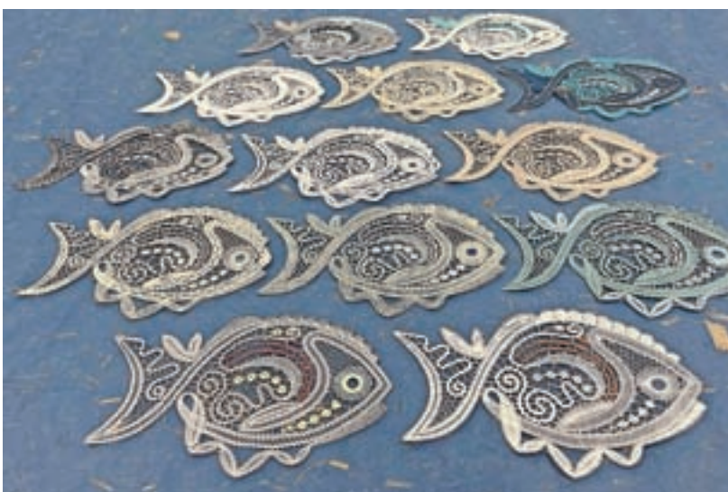
Za letošnji natečaj so izbrali vzorec ribe.