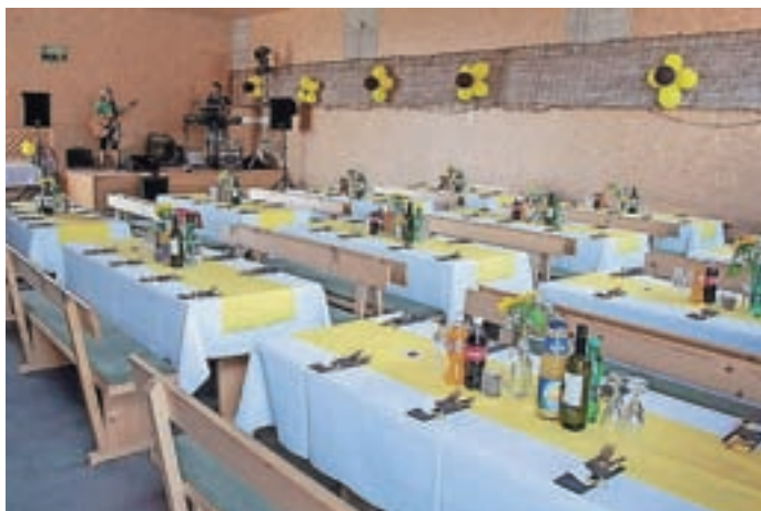
Piknik prostor Jurka sprejme do 120 ljudi in je primeren za vse vrste zabav in dogodkov.