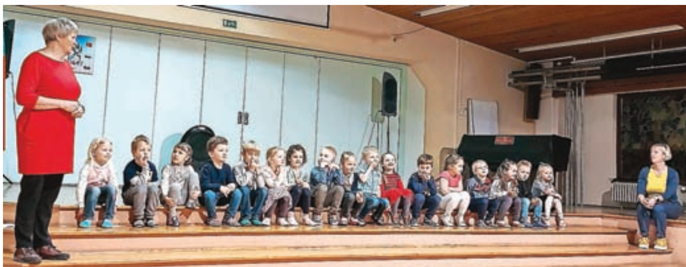
Raziskovalčki so s pesmijo pozdravili pomlad.